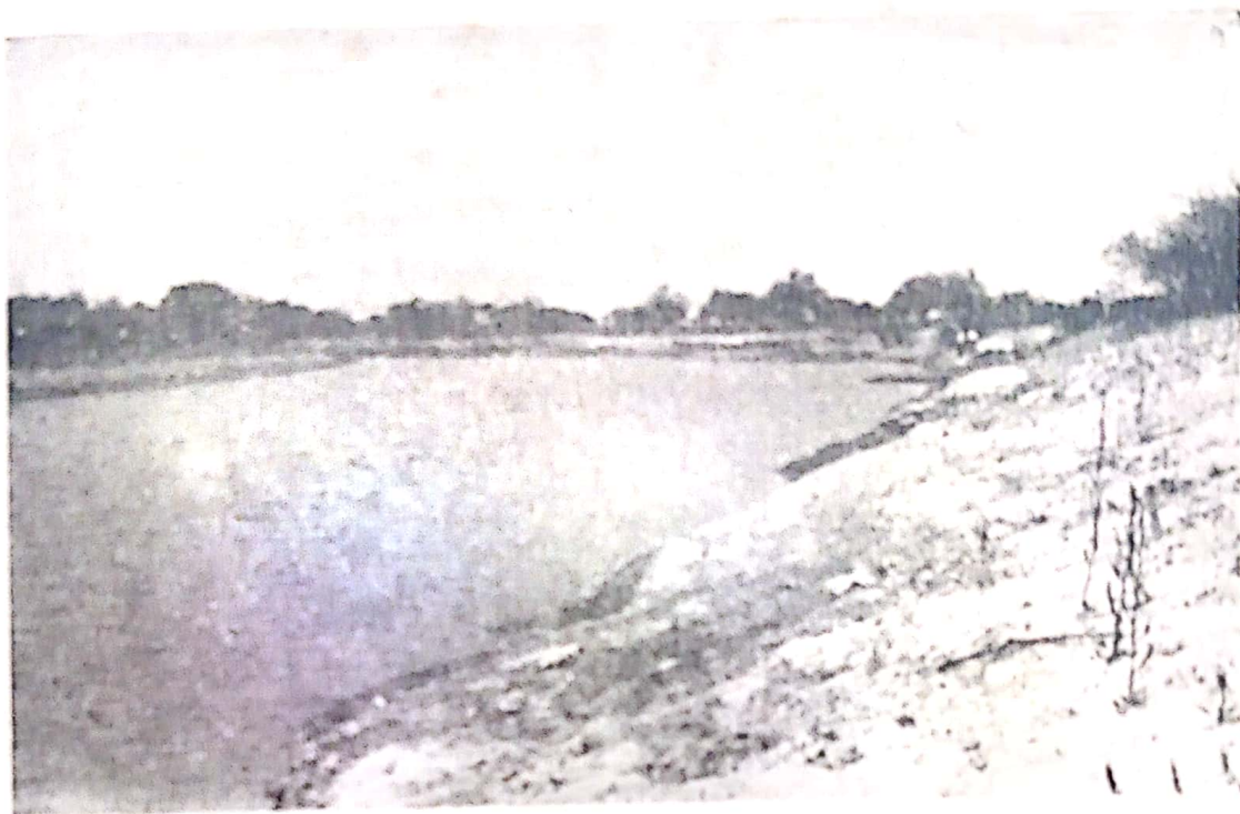
Aspecto panorámico del Río Salado

algo remisa nuestra justicia, que, según declaraciones de Rodolfo Gessler se inclinaba en favor de los colonos y cuando uno de ellos por circunstancias trágicas mata a un gaucho vengando al amigo.