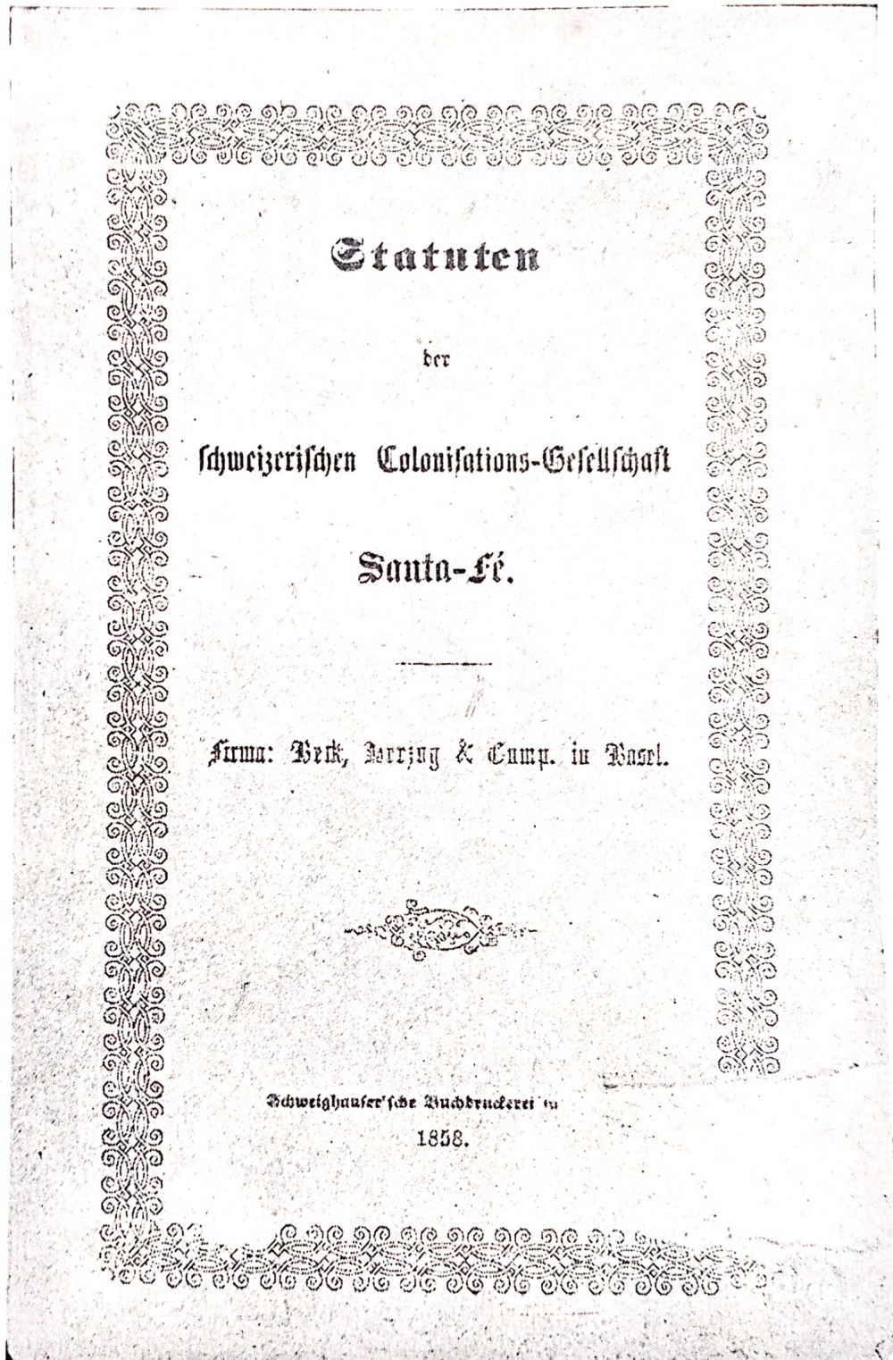
Carátula de los estatutos de la Sociedad Colonizadora Beck-Herzog

que, favorecidos por excelente predisposición a ayudarlos, menosprecian la intervención de los naturales del país en sus asuntos. Esto puede decirse a casi un siglo de aquellos establecimientos numerosos de familias que tanto hicieron por nuestro adelanto. Era