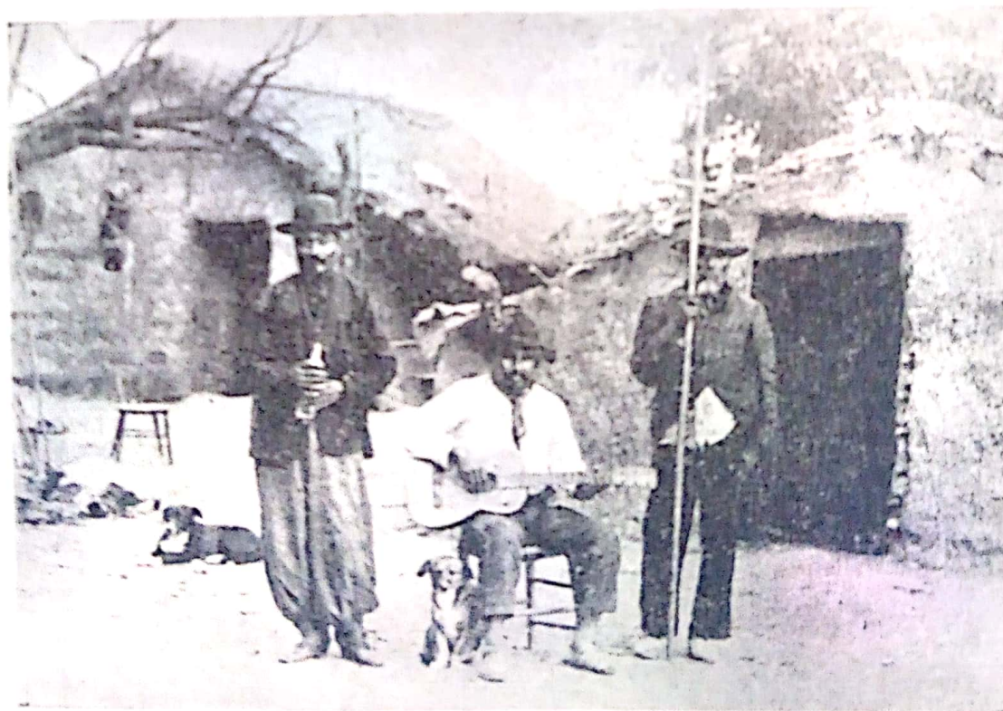
Tipos criollos de la época de colonización